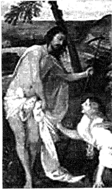
Cuadro de Tiziano (detalle)

Jesucristo es el tercer hijo de la parábola del Padre misericordioso que, en sus