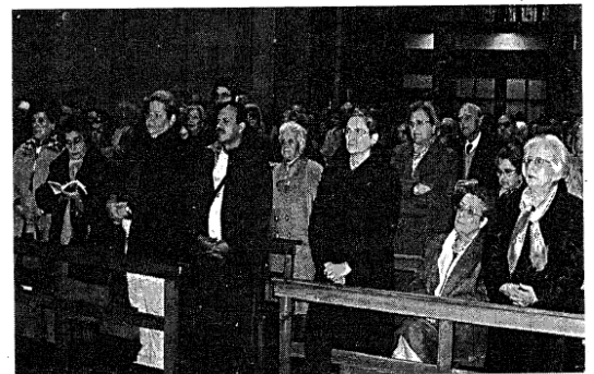
L'església de l'Immaculat Cor de Maria (Padres) es va omplir